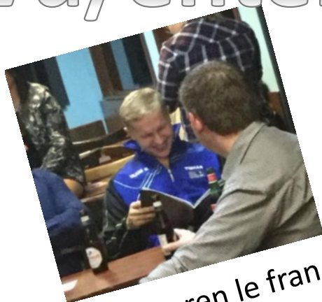
« Je pren le fran sè »